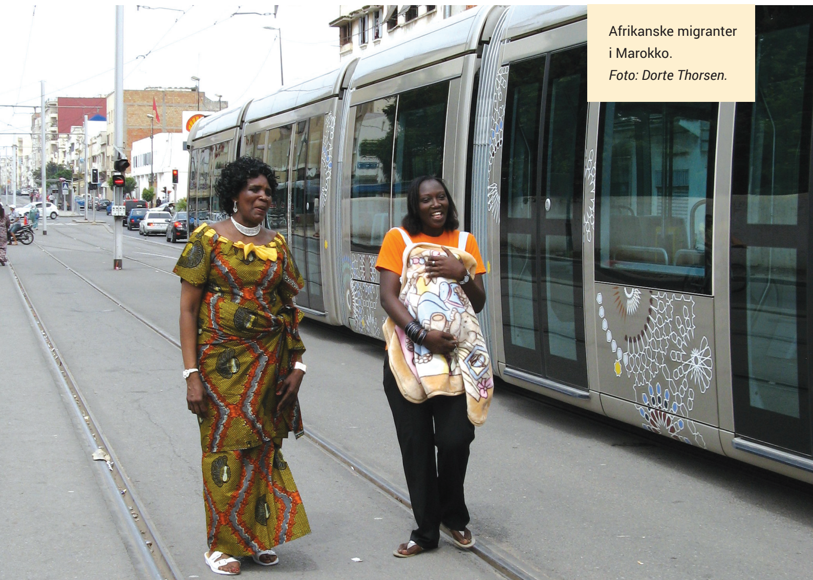
Afrikanske migranter i Marokko.