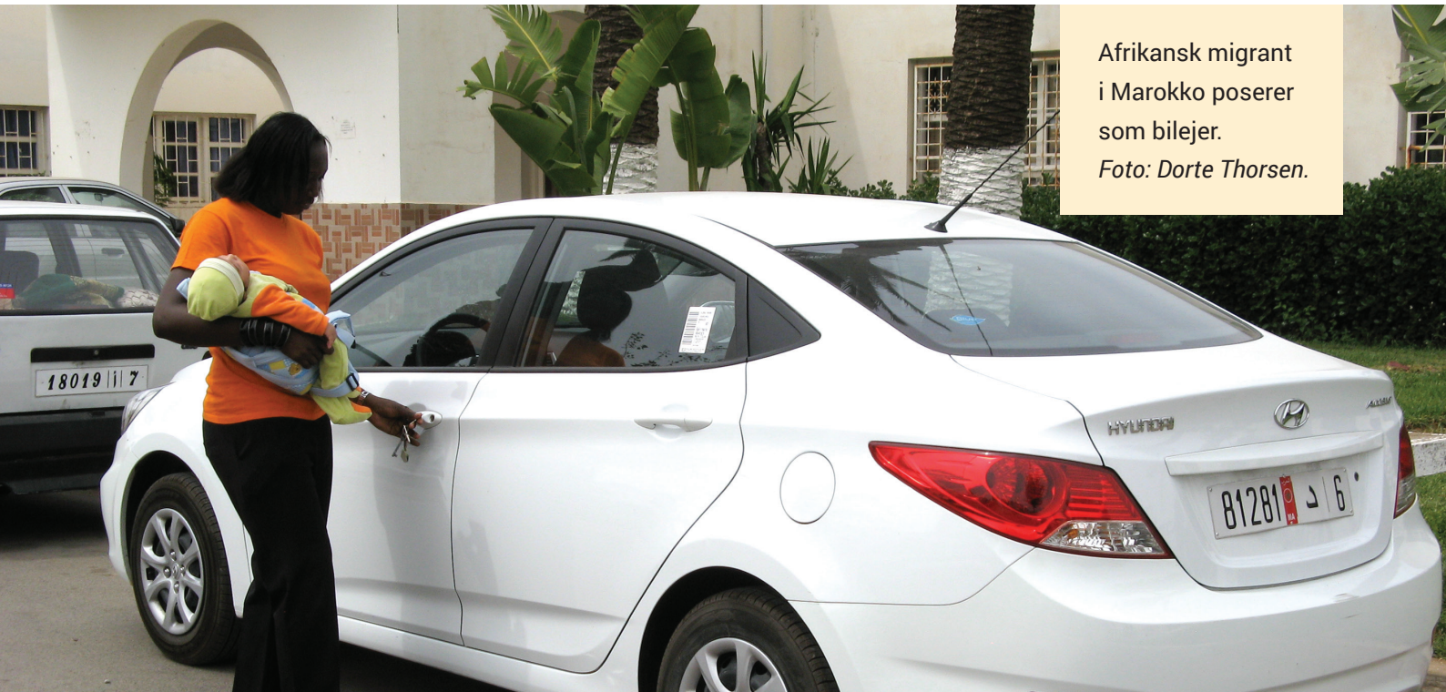
Afrikansk migrant i Marokko poserer som bilejer.