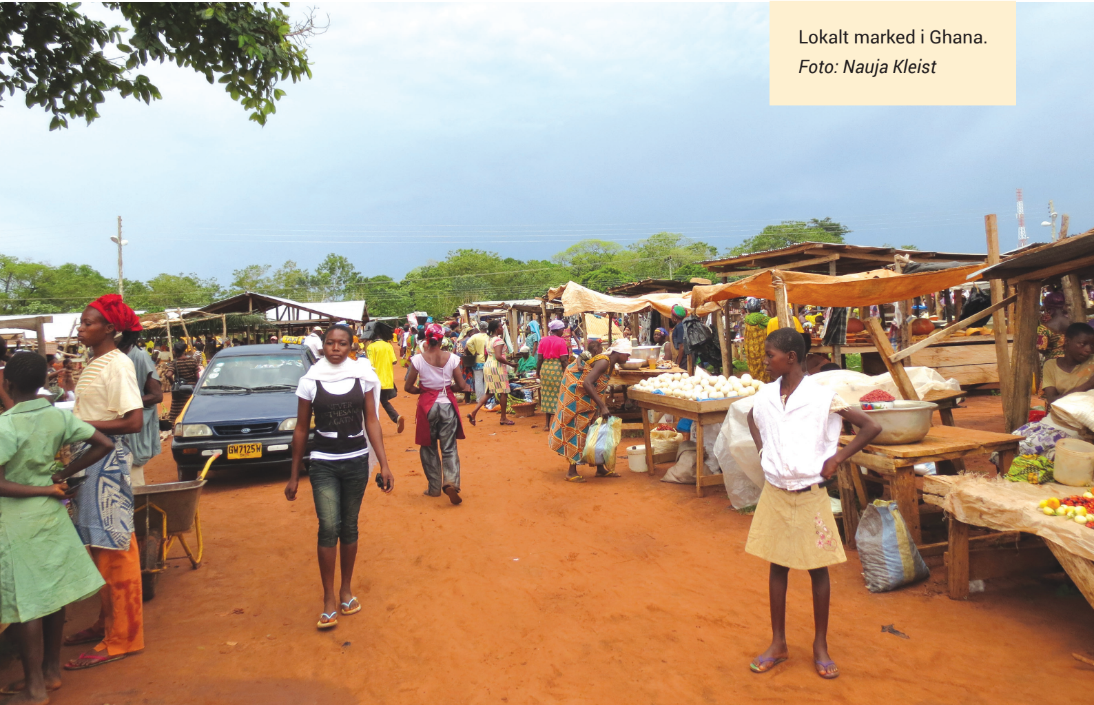
Lokalt marked i Ghana.