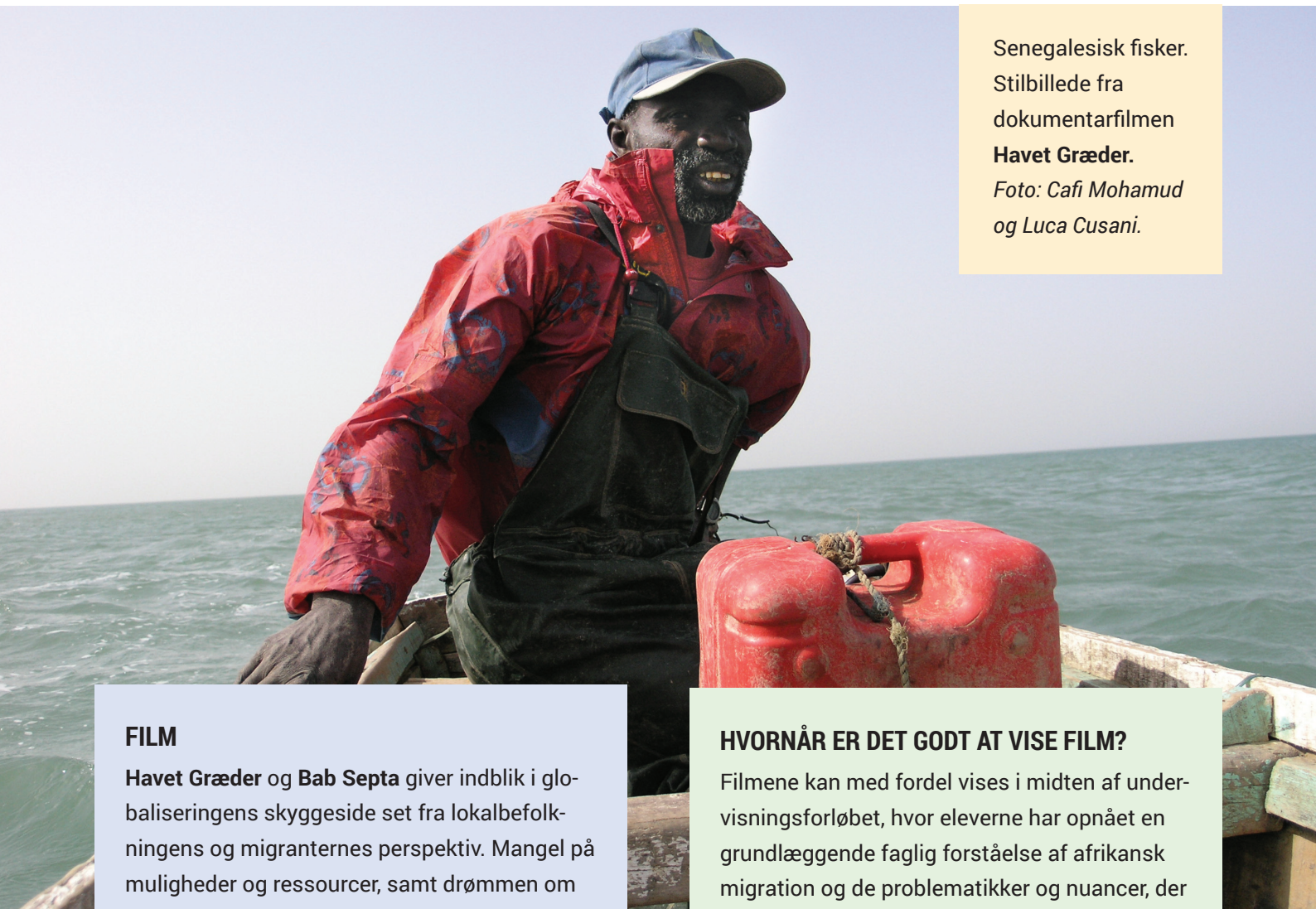
Senegalesisk fisker. Stilbillede fra dokumentarfilmen Havet Græder.