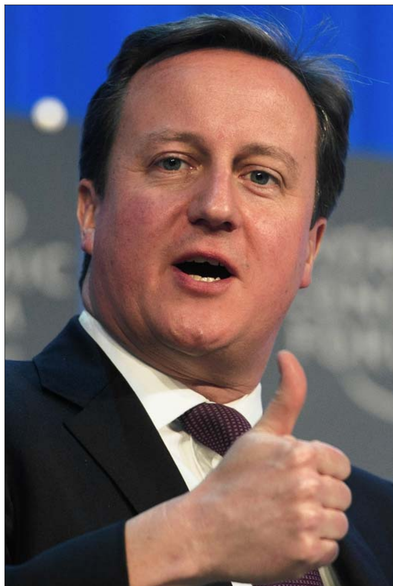
Den nuværende EU-debat i Storbritannien og de problemer, EU repræsenterer for det britiske, konservative parti, går tilbage til december 2005, da David Cameron blev formand for partiet.

Omvendt er Danmark et lille og socialt orienteret land, som foreløbig ikke vil blive kastet ud i en lignende debat – også selvom kritikken af EU vil vokse i Danmark.«