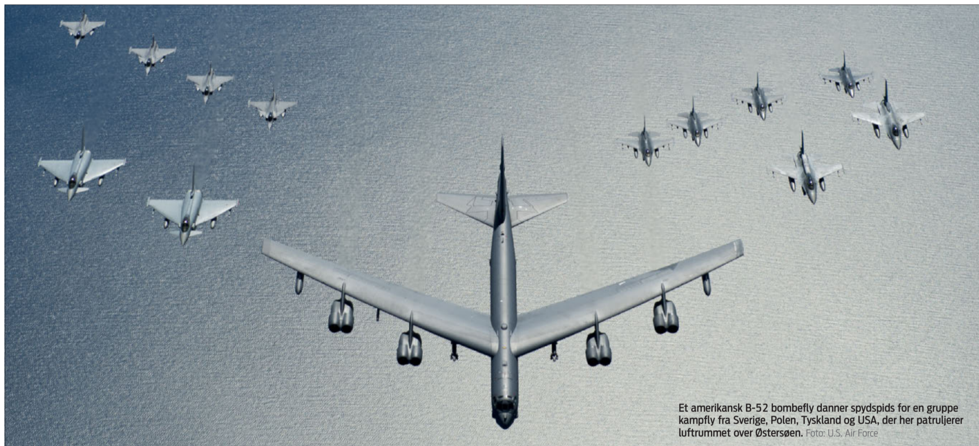
Et amerikansk B-52 bombe-fly danner spids for en gruppe kampfly fra Sverige, Polen, Tyskland og USA, der her patruljerer lufrummet over Østersøen.

Et bredt politisk flertal vil afskaffe det lovpligtige alderstjek af 75-årige bilister . INDLAND, side 2