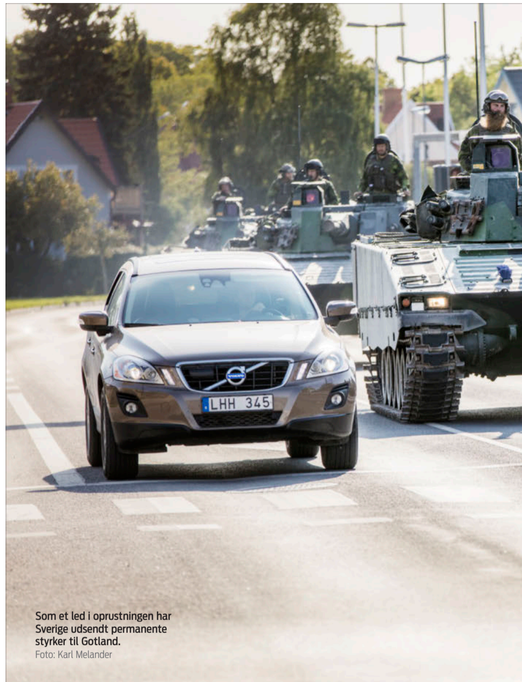
Som et led i oprustningen har Sverige udsendt permanente styrker til Gotland.