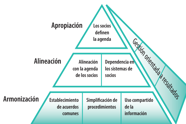
Figura 1: Conceptos de la Declaración de París

De varias formas, el diagrama piramidal reproducido en la Figura 1 ha sido ampliamente divulgado, proporcionando una definición clara y accesible de los principales términos como apropiación por el país, alineamiento de políticas y sistemas, armonización y la forma de relacionarse unos con otros, y la cuestión central de cómo gestionar por resultados en términos de desarrollo.