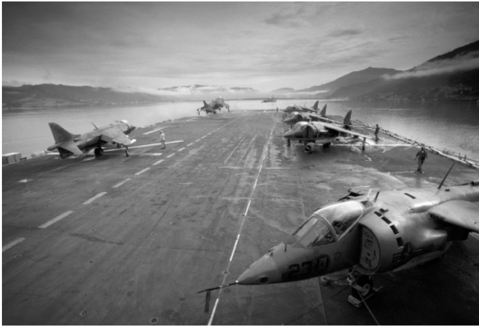
Starten af 1980'erne bød på forøgede øvelsesaktiviteter, bl.a. i Nordatlanten. Her er det NATO-øvelsen Teamwork Exercise , afholdt i Norge den 1. september 1980.

Planen for psykologisk krigsførelse indebar tydeligt nok flådeøvelser af større omfang end tidligere og i farvande tættere på Sovjetunionen (i Norskehavet, Østersøen, Sortehavet og i Stillehavet ud for Sibirien). Ifølge Nigel West er der ingen tvivl om, at NATO og den amerikanske flåde blev opfordret til at antage „en dramatisk mere aggressiv holdning“ under øvelserne. Samtidig blev en ny og offensiv „fremskudt sømilitær strategi“ foreslået (vedtaget i 1984 som „The Maritime Strategy“), der sigtede mod at rette afgørende stød i en tidlig fase af en konflikt mod strategisk vigtige positioner i Sovjetunionen, heriblandt de vigtigste flådebaser og kommandoposter. Det indebar hurtige fremstød mod Kola-halvøen, de sovjetiske „bastioner“ for strategiske ubåde i Det Nordlige Ishav og formentlig også mod mål i Østersøen og forudså en betydelig udvidelse af flåden („600 ships navy“). Den nye strategi blev afprøvet allerede i august-september 1981 gennem øvelsen „Ocean Venture 81“, hvor amerikanske hangarskibsgrupper blev bragt ind i Norskehavet. I en fase af øvelsen skulle en krydser og tre andre skibe være sejlet til