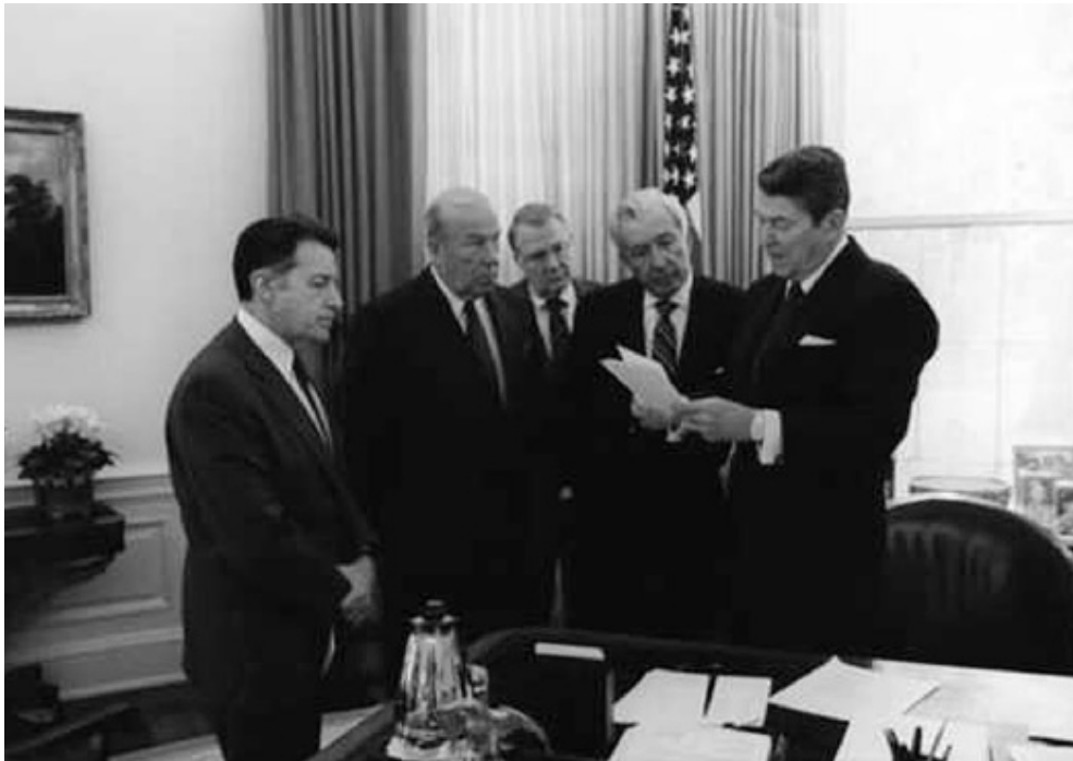
Ronald Reagan diskuterer udtalelser omkring Iran-contra-affæren, sammen med forsvarsminister Caspar Weinberger, udenrigsminister George Shultz, statsadvokat Ed Meese, og finansminister Don Regan i det ovale kontor den 25. november 1986.

logisk krigsførelse direkte rettet mod Sovjetunionen. Den nye administrations store vægt på hemmelige operationer fandt bl.a. udtryk i, at den nye CIA-leder William Casey som den første efterretningschef fik ministerrang. 9