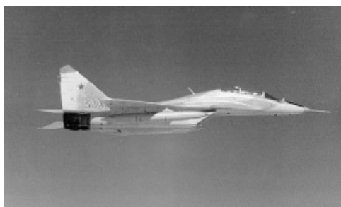
Sovjetisk "Fulcrum"-fly.

dre tyske grænse. Flyet var et altvejs- og dag-og nat-fly, der kunne udføre en række komplicerede efterretningsopgaver. 74