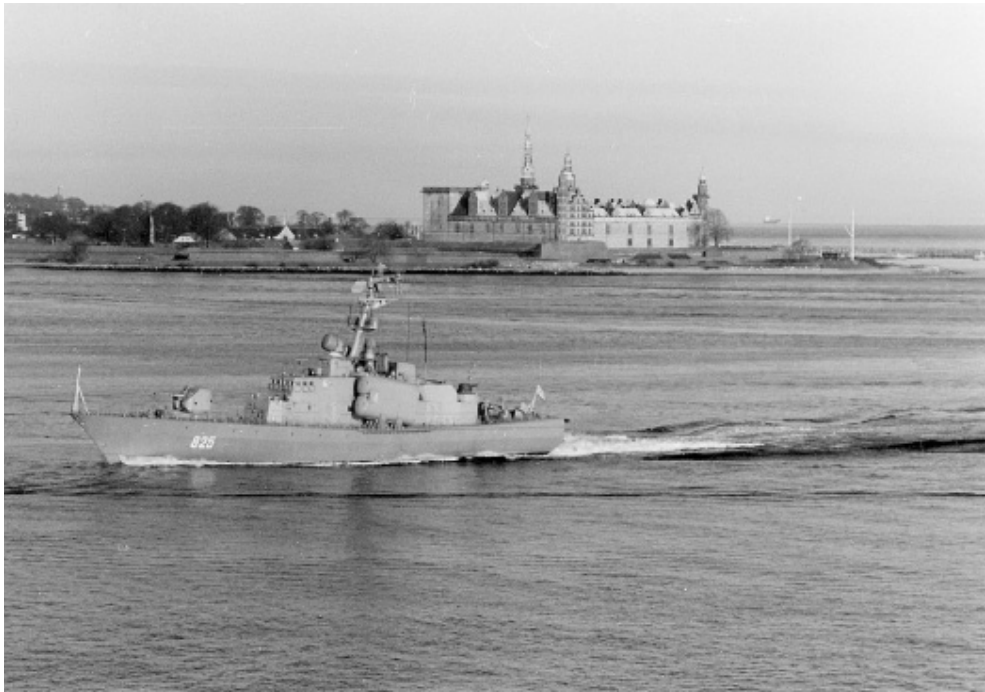
I dansk farvand. En "Tarantul" I klasse missilkorvet runder Kronborg efter en Sjællands-omsejling i 1988.

Polen fik i sommeren 1986 overdraget en moderne Kilo-klasse ubåd. I slutningen af 1987 blev der tillige i Østersøen registreret en Foxtrot-klasse ubåd med polsk flag. Foxtrot-klassen var en forholdsvis avanceret ubåd, og ifølge FE var det „overraskende“, at Polen nu besad den. Man tolkede det som en midlertidig tilgang bestemt af uddannelseshensyn. 52 Da den polske flåde i januar 1988 fik et nyt flagskib i form af en stor sovjetisk missiljager af Kashin Mod-klassen, så FE erhvervelsen i lyset af „poliske prestigebehov“, herunder fornyet deltagelse i den fælles flådestyrke i Nordatlanten. Fartøjet ville ikke opfylde noget reelt operationsbehov, hed det, men blot belaste de i forvejen begrænsede ressourcer. 53