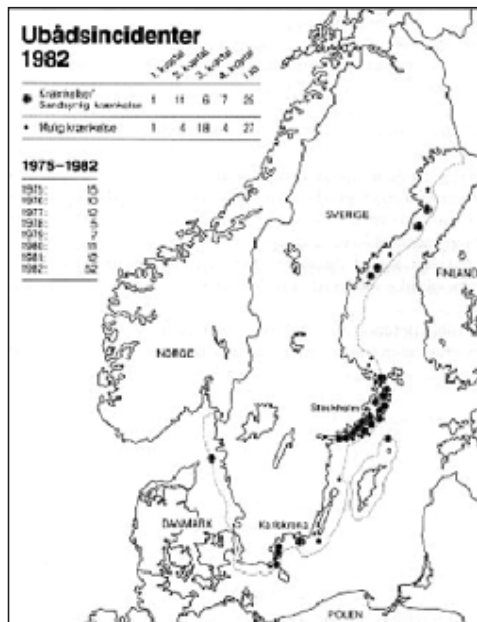
Den svenske forsvarsstabs oversigt over incidenter i 1982 angiver 52 sikre, sandsynlige og mulige ubådskrænkelser. Kortet er hentet fra "Incidenter 1982", udgivet af den svenske forsvarsstabs informationsafdeling i 1983.

Den strategiske målsætning for Warszawapagten i tilfælde af en væbnet konflikt vurderedes i 1980'ernes begyndelse som tidligere at være at nedkæmpe NATO's styrker ved et omfattende angreb på og gennembrud af Central-