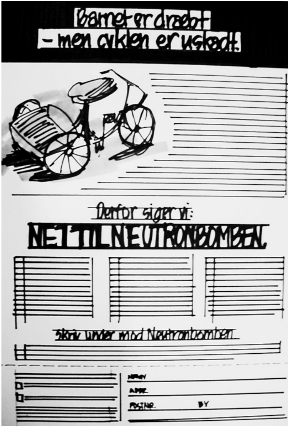
Udkast til underskriftindsamling mod neutronbomben, formentlig organiseret af Samarbejds-komiteen for Fred og Sikkerhed. 1979. (ABA).