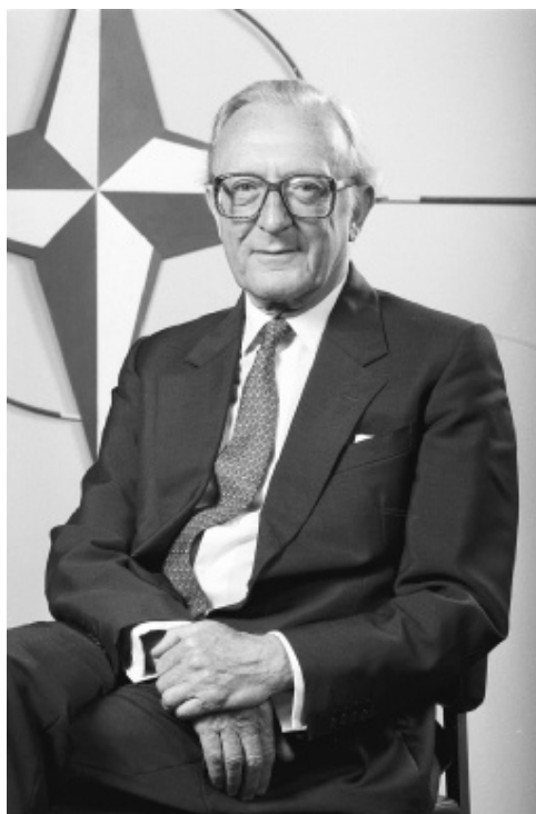
Lord Carrington, NATO's generalsekretær 1984-1988.