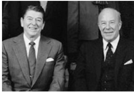
Præsident Reagan og hans udenrigsminister George Shultz.

USA gjorde noget, ville man fra europæisk side til sin tid sikkert kritisere USA for ikke at have taget sine forsvarsforpligtelser alvorligt. Om det danske afslag på at deltage i forskningen vedr. SDI, se martsdagsordenen, så gjorde USA faktisk Danmark en tjeneste ved at tilbyde kontrakter og teknisk viden, og hvis Danmark ikke ville deltage i den teknologiske udvikling, så måtte man håbe, at Herren ville hjælpe danskerne, som