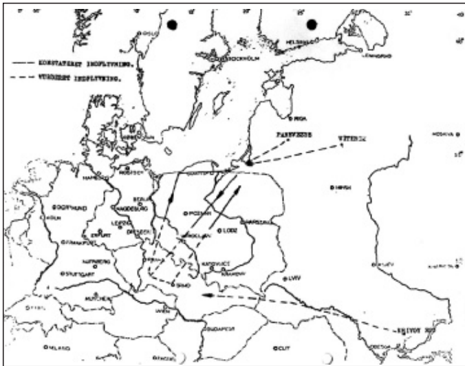
Kort over sovjetiske indflyvninger ved invasionen af Tjekkoslaviet i 1968, udarbejdet af FE. (FE).

Det blev dog bemærket, at Prag blev besat af en luftbåren styrke, ligesom der blev kastet luftbårne styrker ned ved flere flyvepladser. Man hæftede sig også ved, at besættelsen af de tjekkoslovakiske flyvepladser foregik „gnidningsløst og med stor præcision, således landede An-12 transportfly i Prags lufthavn med ca. 1 minuts mellemrum i de første timer efter invasionen“. Det tilføjedes dog samtidigt, at der ikke fra tjekkoslovakisk side blev taget modforholdsregler. 22 Det rapporteredes også, at den i Danmark velkendte polske 6. luftbårne division havde deltaget i operationerne og formentlig været under sovjetisk kommando. Det påpegedes også, at invasionsstyrkerne efter få dage fik problemer med forsyninger af proviant og drivmidler. Der blev ikke foretaget nogen afvæbning af de tjekkoslovakiske styrker.