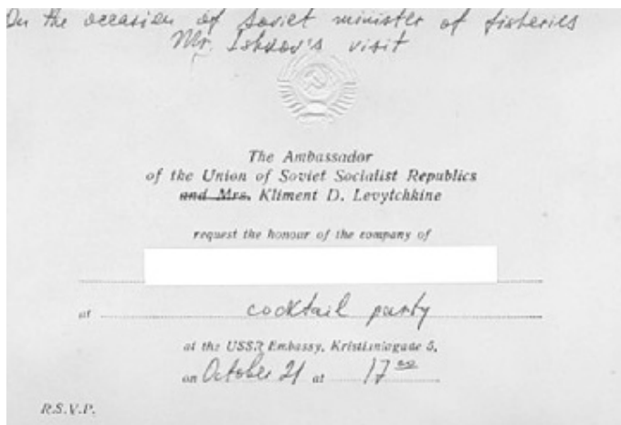
Invitation til cocktail-party på ambassaden. (Privateje).

igennem en årrække havde arbejdet for KGB og havde til opgave at informere KGB om de politiske diskussioner inden for SF's ledelse. 78