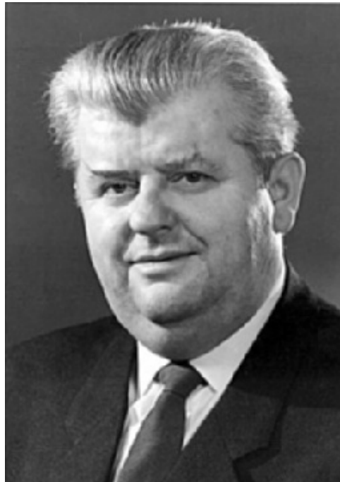
Per Hækkerup, udenrigsminister 1962-1966. Siden finans- og økonomiminister i skiftende regeringer.

De danske myndigheder fastholdt i 1963-64 deres opmærksomhed omkring MLF-sagens sovjetiske aspekter, hvilket formentlig også var en medvirkende årsag til, at Krag kort inden ministerpræsident Khrusjtjovs besøg i København i sommeren 1964 klart erklærede, at Danmark ikke ville deltage i