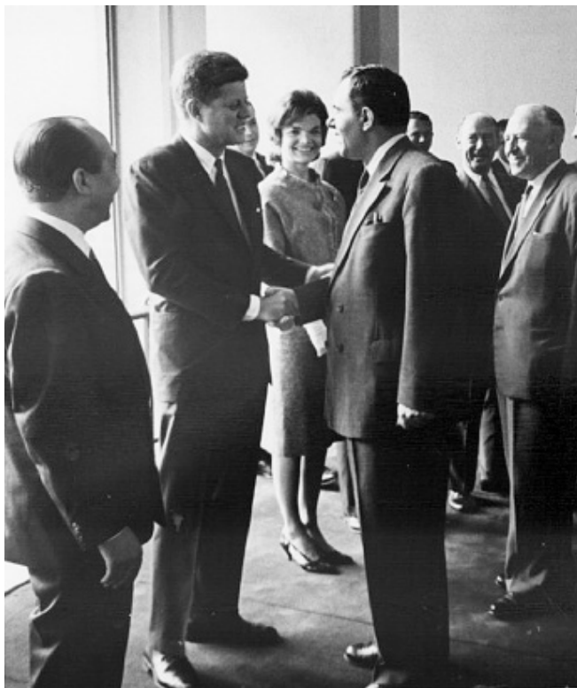
Gromyko i samtale med præsident Kennedy under besøg i FN, september 1961.

Fra dansk side havde man fra begyndelsen været opmærksom på kompleksiteten i det tyske problem, og den danske holdning til aspektet omkring forbundshærens adgang til atomvåben i forbindelse med MLF havde været præget af en betydelig ambivalens. På den ene side var Vesttyskland konsekvent en anstødssten i de danske overvejelser, da MLF kunne betyde eller i det mindste opfattes som tysk atombevæbning. På den anden side kunne MLF måske fungere som en kærkommen mulighed for inddæmning af Vesttyskland ved at undgå national