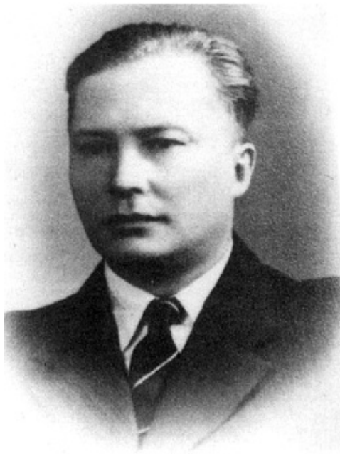
Den sovjetiske ambassadør i Danmark fra 19. juli 1955 til 9. september 1958, N.V. Slavin.

De sovjetiske reaktioner viser med stor tydelighed, at frygten for Vesttyskland og det, man fra sovjetisk side opfattede som vesttysk revanchisme, spillede en afgørende rolle for Sovjetunionens politik.