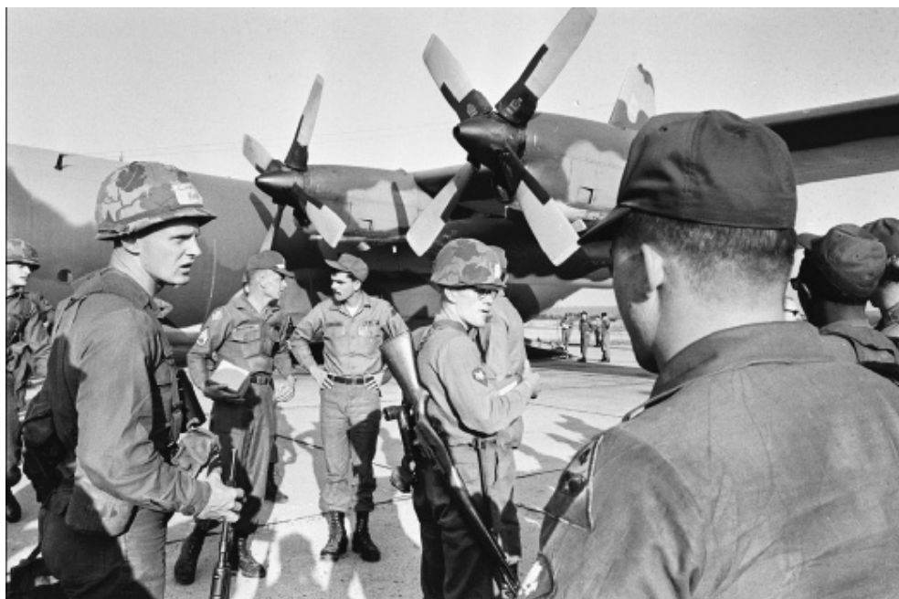
Nato-øvelsen „Operation Big Lift“ i oktober 1963. 14.500 amerikanske soldater blev fløjet til Europa for at demonstrere evnen til hurtig forstærkning tværs over Atlanten i tilfælde af angreb.

Vestens evne til at svare igen nukleart mest muligt. Man forventede et sovjetisk overraskelsesangreb med henblik på at ødelægge så stor en del af de vestlige kernevåben som muligt gennem angreb på baser, våbendepoter og hangarskibe.