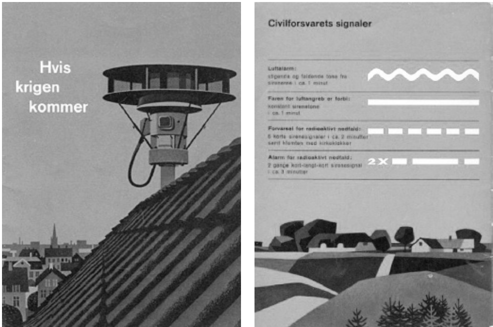
Forside og bagside af pjecen „Hvis krigen kommer“, udsendt af Statsministeriet i 1962.

kommer“ (33 s.), der må karakteriseres som sober oplysning om et alvorligt emne. Pjecen skulle advare befolkningen om de risici, den kunne blive udsat for i forbindelse med en krig, der kunne være en atomkrig, men tillige orientere om de statslige foranstaltninger og hvad den enkelte borger selv kunne gøre i situationen.