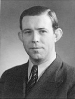
Poul Hansen, forsvarsminister 1956-1962, finans- og økonomiminister 1962-1965.

svarsmæssigt nødvendig integration, som især enhedskommandoen, men også oprettelse af de vesttyske depoter var udtryk for. Dertil kom en række andre forhold, der pegede i retning af etablering af et gradvist tættere militært samarbejde med Forbundsrepublikken. For det første var der hensynet til USA og Storbritannien, som ikke så positivt på en stadig dansk vægning, og for det andet hensynet til Vesttyskland, der både af handelsmæssige og politiske årsager pegede i retning af en stadigt større militær integration.