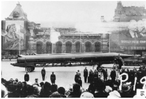
Den marxistisk-leninistiske ideologi var allestedsnærværende i det sovjetiske samfund, og billeder af Marx og Lenin fandtes både på pengesedler og frimærker. Her hænger de ved en militærparade på Den Røde Plads i Moskva.

jetisk offentlighed af, om en bestemt sovjetisk udenrigspolitik nu også var den rette i forhold til den videnskabelige sandhed om historiens udvikling. Der var under den kolde krig utvivlsomt forskellige opfattelser af spørgsmålet i Sovjetunionens kommunistiske parti (SUKP) og elitegrupper i sovjetsamfundet, og i sovjetiske medier og litteratur blev der i et vist omfang fremlagt varierende versioner af marxismen-leninismen og dens konkrete politikkonsekvenser. Sådanne forskelle gav sig imidlertid ikke udslag i offentligt erkendte stridigheder, som resulterede