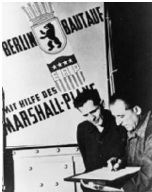
Politisk-civile strategier: økonomisk i form af Marshall-planen og psykologisk i form af oplysning om planens nyttige virkninger for samfundet.